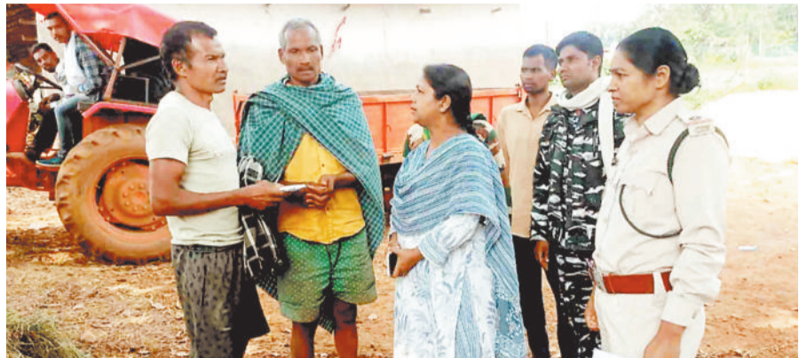
परिजन को सहायता देती वन अधिकारी।

हरिभूमि न्यूज ►► घोरपुर लम्बे समय से लुपड़ा जंगल में अकेले घूम रहे दंतैल ने बीती रात ग्राम चलगली में एक युवक की कुचल कर जान ले ली। युवक अपने दो साथियों के साथ चलगली के रास्ते अपने घर लौट रहा था इसी दौरान युवक का दंतैल से सामना हो गया। दंतैल द्वारा युवक पर हमला करने के दौरान उसके दो साथियों ने किसी तरह भागकर अपनी जान बचाई। वन परिक्षेत्र लुपड़ा में अप्रैल महीने से ही एक दंतैल आसपास के जंगलों में भ्रमण कर रहा है। ग्रामीणों के अनुसार भ्रमण के दौरान दंतैल कई बार मुखमार्ग एवं आसपास के गांवों में पहुंचा लेकिन कभी कोई क्षति नहीं पहुंचाई। उसने न तो कभी घरों में तोड़फोड़ किया न ही किसी पर हमला बोला। गाँव के मौसम में दंतैल को कई बार मुख्य मार्ग एवं आबादी क्षेत्र में ग्रामीणों ने उसे पका आम तोड़ते एवं खाते देखा है। इस दौरान जानकारी के अभाव में ग्रामीण