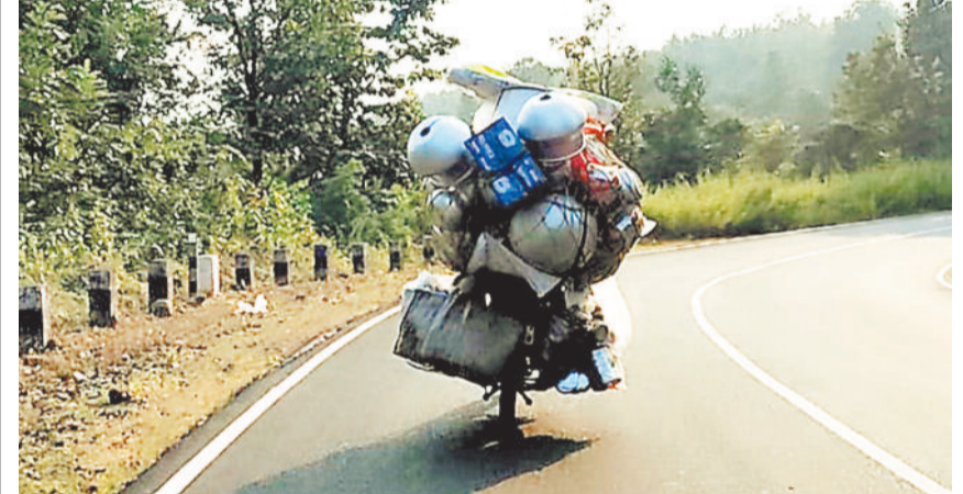
बैकुण्ठपुर। फेरी वालों के द्वारा दूधिया वाहनों में क्षमता से अधिक सामान लेकर सड़कों पर सरपट दौड़ते हैं, जो स्वयं के साथ दूसरों के लिए दुर्घटना का कारण बन सकते हैं, ऐसी फेरी वाले शहर के बीच से लेकर घाटी वाले क्षेत्रों में भी बेधड़क आवाजाही करते हैं।