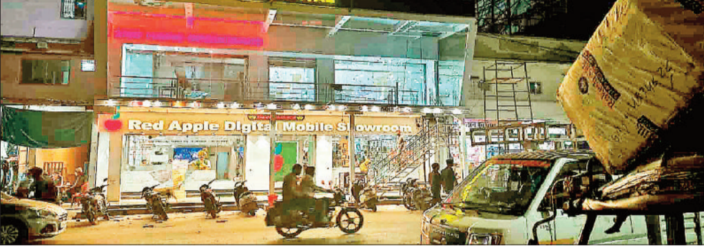
शहर में संचालित दुकान में पसरा सन्नाटा।

ग्राहकों की कमी से बाजार की रौनक फिका, दुकान संचालक परेशान